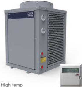
PPT-060MSVS PAC Pooltemper High temp With Wired Digital Controller